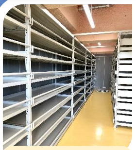
個別安置室 約 1500 壺収容

近江八景「瀬田の夕照」 をイメージし、霊園に休ま れる魂の総体を象徴する 球体を表現しました。