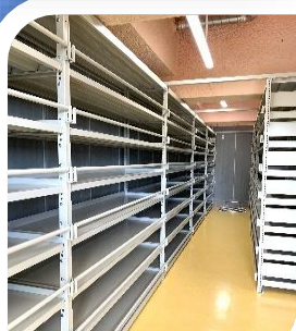
個別安置室 約 1500 壺収容

近江八景「瀬田の夕照」をイメージし、霊園に休まれる魂の総体を象徴する球体を表現しました。